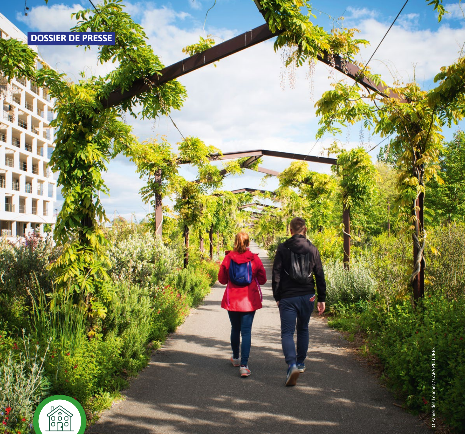
O Panier des Touches