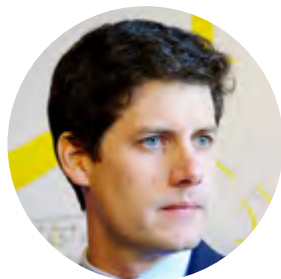
Julien Denormandie, Ministre chargé de la Ville et du Logement

Avec cet appel à projet en faveur de l'agriculture urbaine, l'ANRU va à nouveau participer à changer la vie des habitants des quartiers en mobilisant les énergies des nombreux partenaires associés à cette dynamique. L'État y prendra toute sa part et dévoilera l'ensemble des mesures en faveur de la ville durable le 5 février prochain.